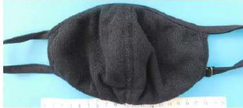
Abb. / Fig. 2: OP-mask