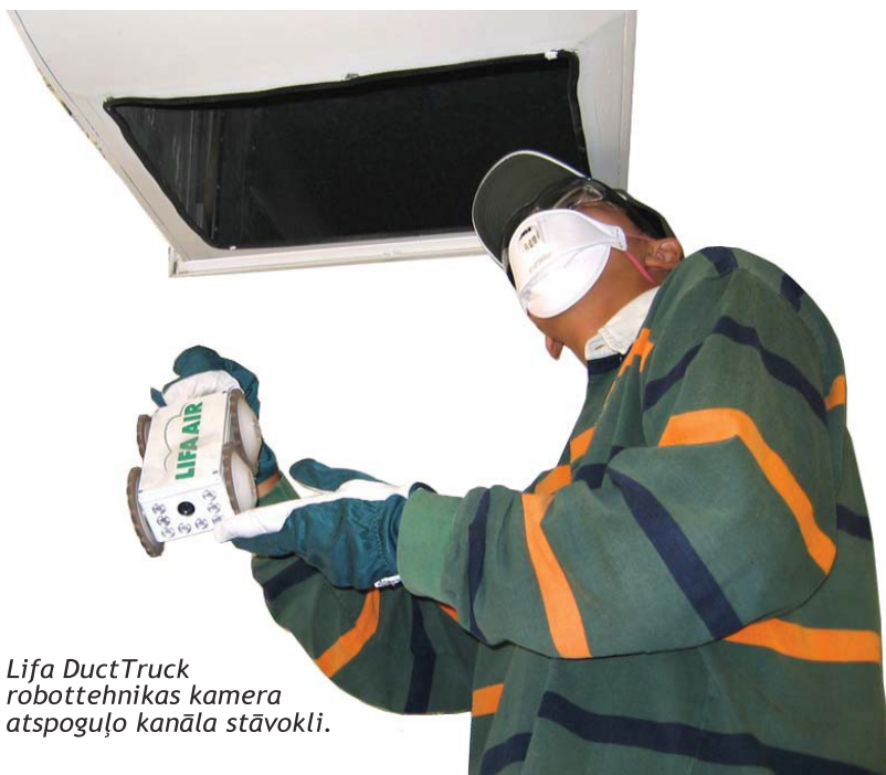
Lifa DuctTruck robottehnikas kamera atspoguļo kanāla stāvokli.

Lifa Air ir specializējies ventilācijas un gaisa kondicionēšanas sistēmas metožu un aprīkojuma izstrādāšanā un ražošanā. Mūsu apskates kameras var darboties gan taisnstūrveida, gan apaļos kanālos, kā arī gan vertikālos, gan horizontālos. Apskates vizualizāciju var uzreiz ierakstīt. Kameras aprīkojumu var izmantot arī tīrīšanas ierīču vadīšanai tīrīšanas procesa laikā.